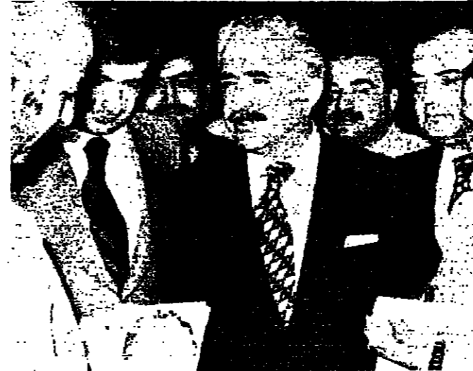
الرئيس كراي يتحدث الى الصحفيين في القصر الجمهوري